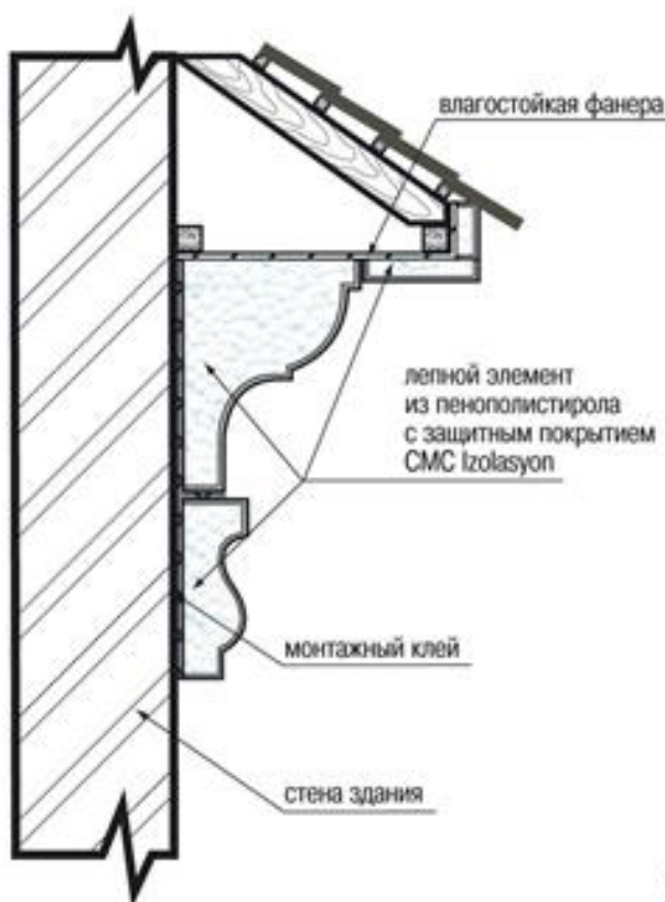
Монтаж на клеевую смесь

Крепить архитектурные детали к основанию можно как одним клеем, так и – дополнительно к клею – с помощью анкерных устройств (дюбелей, грибков) или кладных деталей. При этом