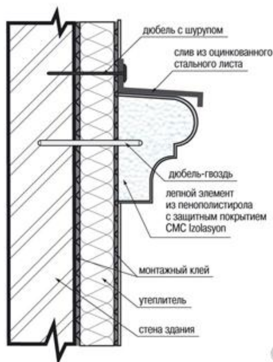
Монтаж изделия на дюбель-гвозди и клеевую смесь