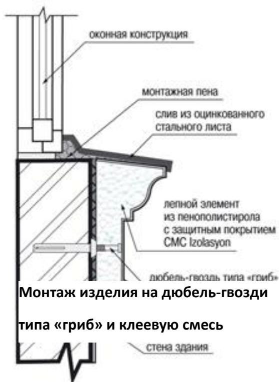
Монтаж изделия на дюбель-гвозди типа «гриб» и клеевую смесь

Если размеры декоративных элементов очень велики, их можно закрепить с помощью обычных дюбелей (без шляпки). Устанавливать крепления в стену следует до приклеивания, чтобы не повредить защитный слой элементов лепнины. При этом